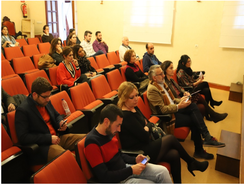
( http://www.aytomoguer.es/export/sites/moguer/es/.galleries/fotos-noticias/2018/02/IMG_4274.jpg )