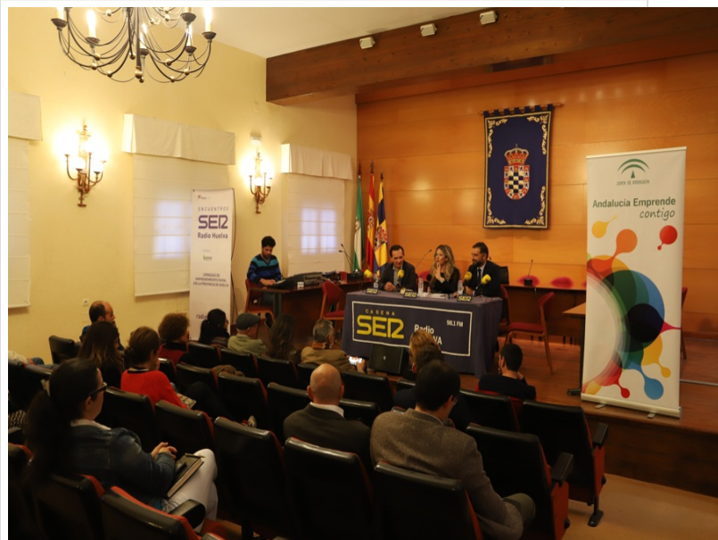
( http://www.aytomoguer.es/export/sites/moguer/es/.galleries/fotos-noticias/2018/02/IMG_4271.jpg )