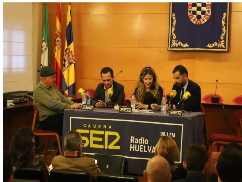
( http://www.aytomoguer.es/export/sites/moguer/es/.galleries/fotos-noticias/2018/02/IMG_4273.jpg )