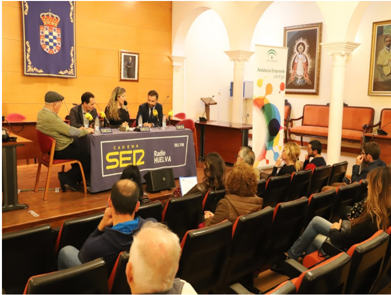
( http://www.aytomoguer.es/export/sites/moguer/es/.galleries/fotos-noticias/2018/02/IMG_4291.jpg )