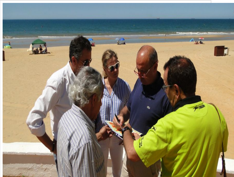
( http://www.aytomoguer.es/export/sites/moguer/es/.galleries/fotos-noticias/2016/06/En-el-lugar-del-torneo.jpg )