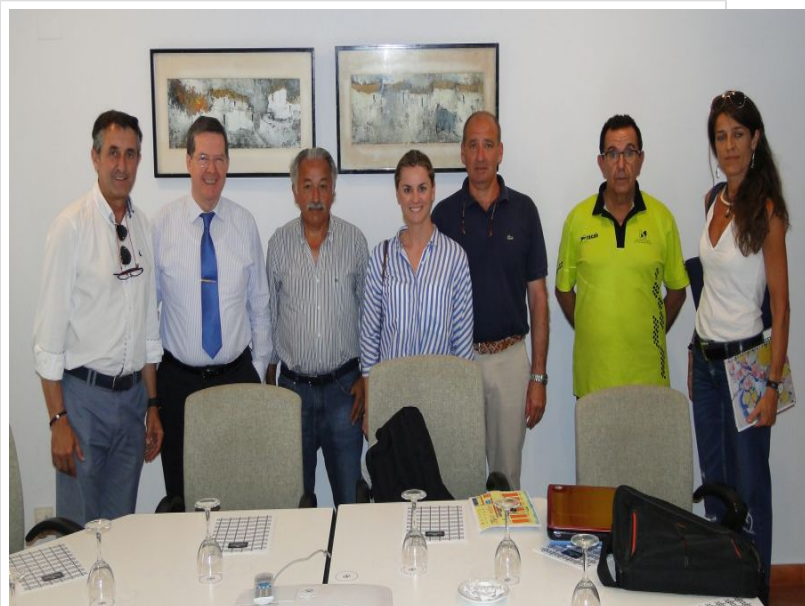
( http://www.aytomoguer.es/export/sites/moguer/es/.galleries/fotos-noticias/2016/06/En-el-Parador-Cristobal-Colon.jpg )