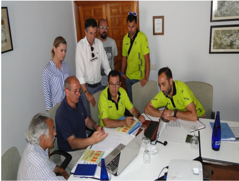
( http://www.aytomoguer.es/export/sites/moguer/es/.galleries/fotos-noticias/2016/06/En-plena-reunion-organizativa.jpg )