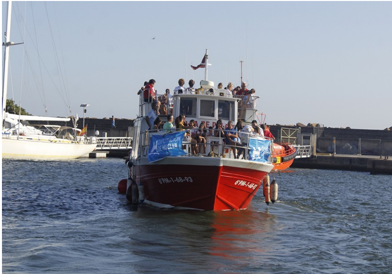
( http://www.aytomoguer.es/export/sites/moguer/es/.galleries/fotos-noticias/2018/08/Paseos-en-barco-por-la-ria.jpg )