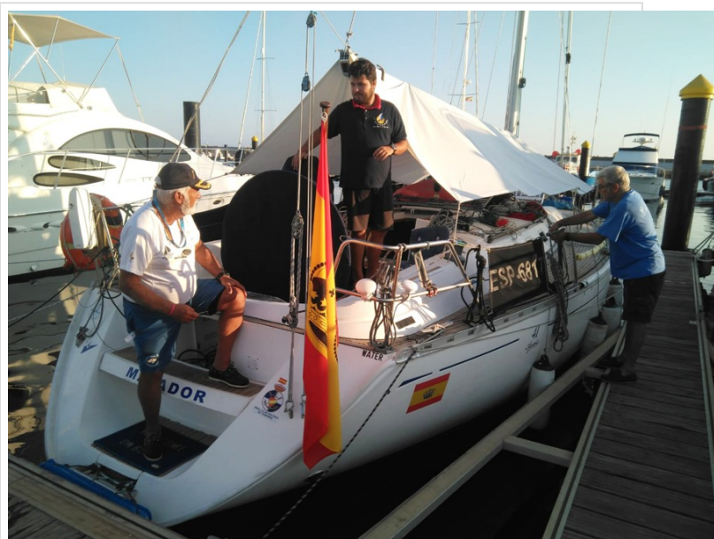
( http://www.aytomoguer.es/export/sites/moguer/es/.galleries/fotos-noticias/2018/08/Los-barcos-competidores-van-llegando-al-pantalan.jpg )

Hoy jueves continúan los talleres infantiles y los paseos en barco por la ría, mientras que la gran cita de la programación festiva será la actuación a partir de las 22 horas del grupo cordobés Los Aslándticos, con su particular manera de entender la música a partir de la fusión de ritmos y estilos de ambos lados del océano; y mañana viernes será protagonista el flamenco con la actuación de artistas onubenses como el grupo PaloDulce, María Canea y Rocío Ojuelo, también en el mismo puerto a las 22 horas. Y todo ello con acceso gratuito para todos los públicos.