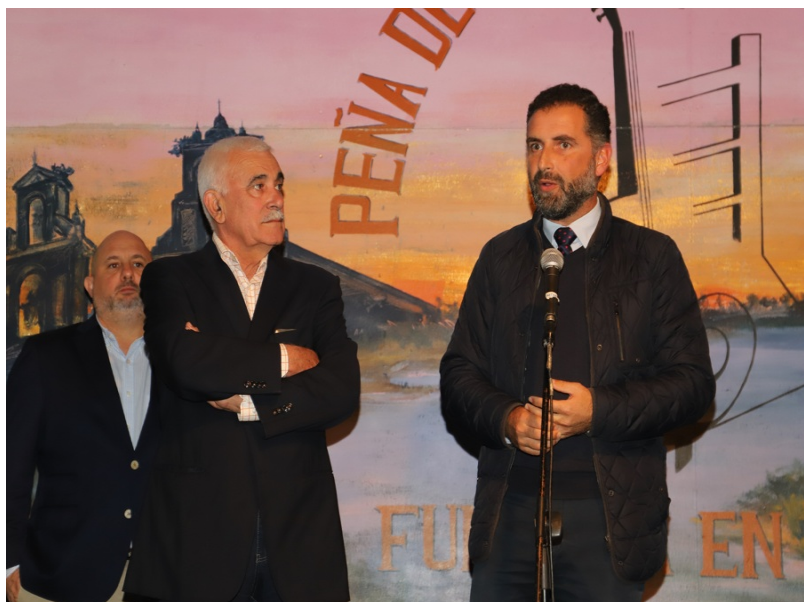
( http://www.aytomoguer.es/export/sites/moguer/es/.galleries/fotos-noticias/2018/11/El-alcalde-de-Moguer-no-falto-a-esta-cita-con-nuestras-tradici )