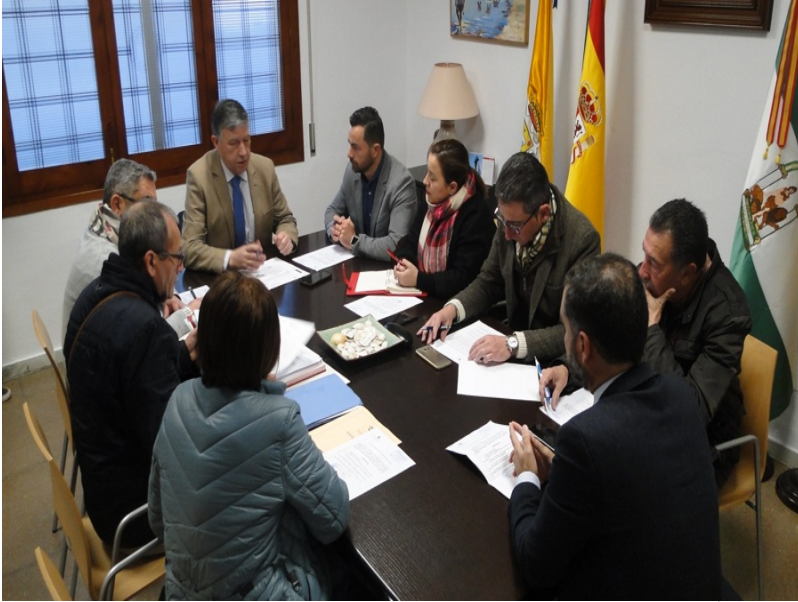
( http://www.aytomoguer.es/export/sites/moguer/es/.galleries/fotos-noticias/2018/01/junta-mancomunidad-2.jpg )