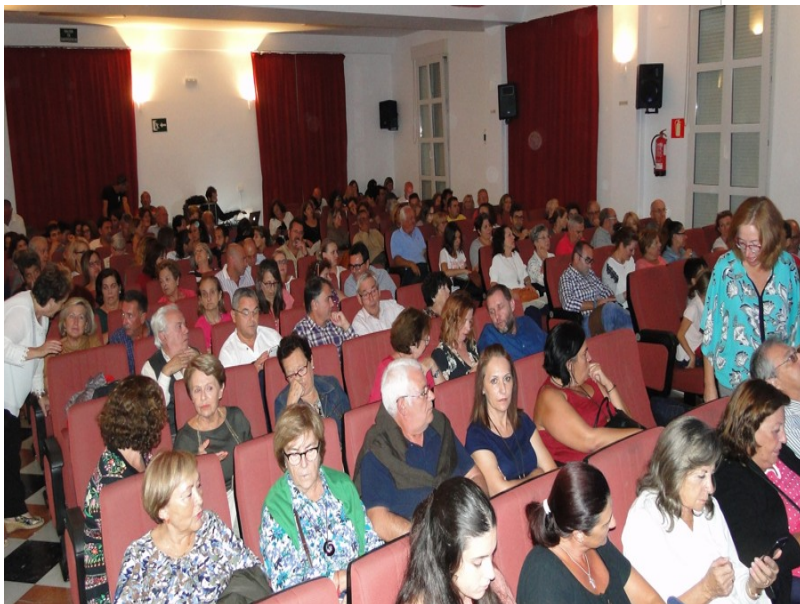
( http://www.aytomoguer.es/export/sites/moguer/es/.galleries/fotos-noticias/2017/10/DSC01207.jpg )