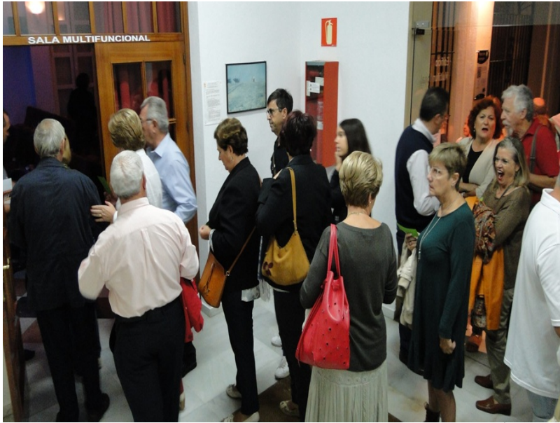
( http://www.aytomoguer.es/export/sites/moguer/es/.galleries/fotos-noticias/2017/10/DSC01204.jpg )