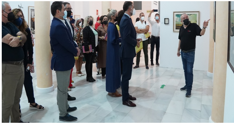
( http://www.aytomoguer.es/export/sites/moguer/es/.galleries/fotos-noticias/2021/10/Sycet-explica-el-contenido-de-la-muestra.jpg )