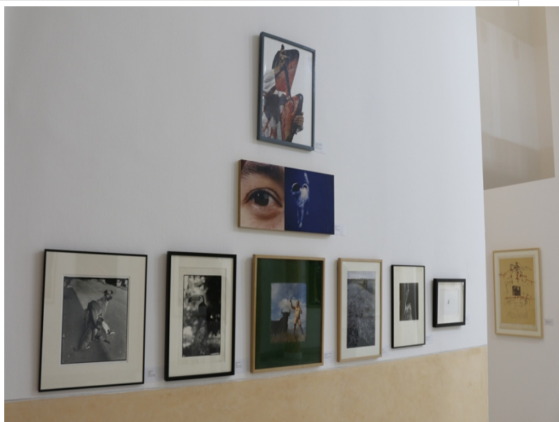
( http://www.aytomoguer.es/export/sites/moguer/es/.galleries/fotos-noticias/2021/10/algunas-de-las-obras-expuestas-5.jpg )